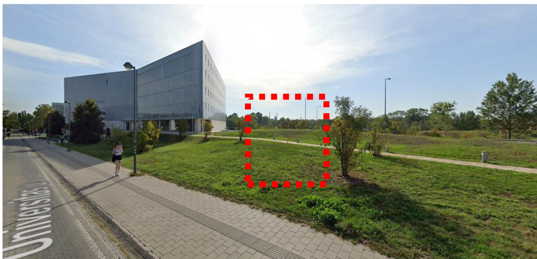
Az emlékoszlop elhelyezésének javasolt helyszíne Részlet a Szabályozási tervből